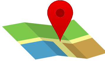
Comprobante De domicilio