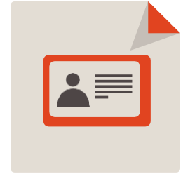
Identificación del padre

Padre pueden calificar con una de las calificaciones de abajo